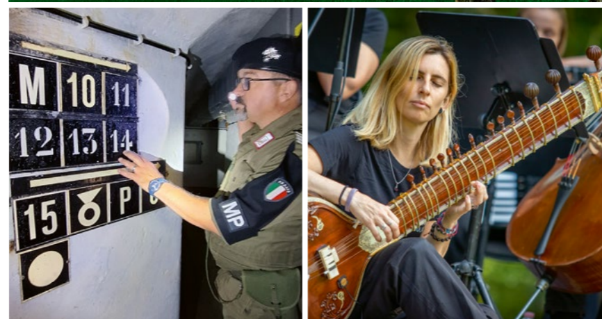
Das Kile Alpine Resort im Val Saisera. Einblick in die lange geheime Bunkeranlage „Forte Beisner, Opera 4“. Das Festival Risonanze jedes Jahr im Juni.