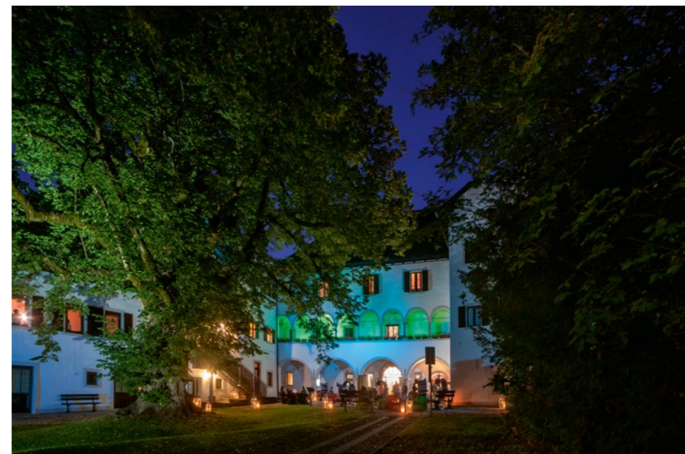
Der Palazzo Veneziano mitten in Malborghetto mit seinem Museum ist der historische, völkerkundliche und intellektuelle Brennpunkt der Region.

Forte Beisner, Opera 4 (Werk 4) | Bis 1991 militärisch genutzt unterirdische Kaserne und Bunkeranlage im Kugel-Berg zwi-