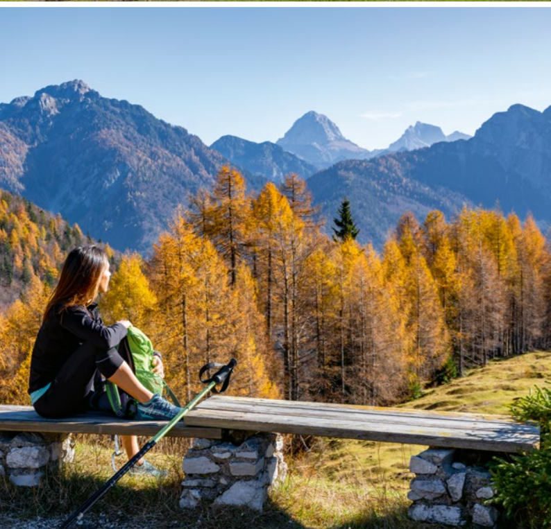
Herbstidylle bis weit in den November: Die Julischen Alpen im Süden und vor allem die weniger hohen Karnischen Alpen im Norden sind lohnende Herbstwanderziele. Genießen kann man im neuen Hotel Hammerack (o.).